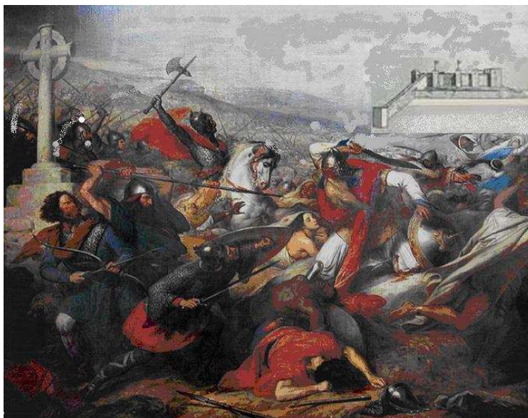
fig.4 Cerco ao castelo

3. Durante as campanhas militares, no século XI, o castelo caiu nas mãos dos mouros e a cidade passou a chamar-se lissabona. Os mouros erguem o castelo sob ruínas de fortificações romanas ampliando as muralhas.