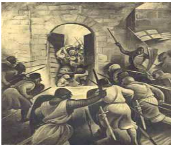
fig.6 Porta Martim Moniz

homenagem e gratidão a São Jorge o castelo foi baptizado com o seu nome e a praça circundante recebeu o nome do fidalgo Martim Moniz.