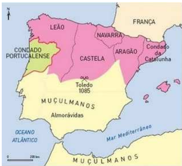
fig.1 Reinos da Península Ibérica

1. Antes do nascimento de Portugal muitos povos passaram pela Península Ibérica, Fenícios, Gregos, Cartagineses, Lusitanos, Romanos, Bárbaros e Muçulmanos.