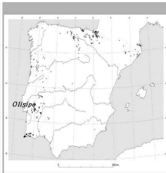
fig. 2 Península Ibérica

1.2. Pinta o mapa da Península Ibérica de acordo com a figura 1.