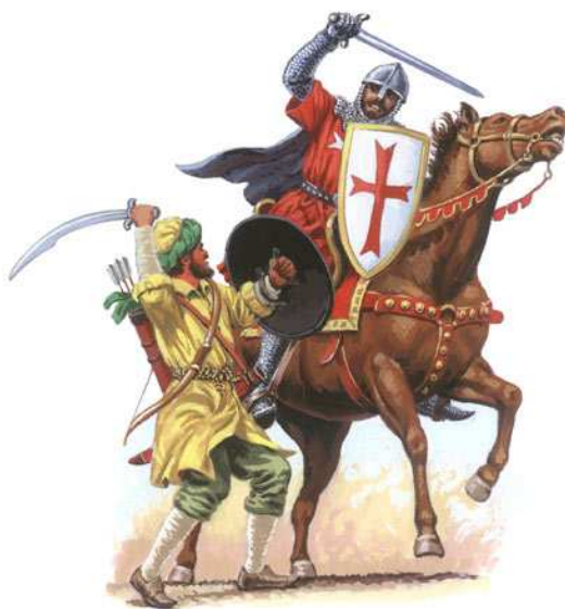
fig.5 D. Afonso Henriques na luta pela conquista de Lisboa

4. A 25 de Outubro de 1147, D. Afonso Henriques cerca o castelo dos mouros sendo ajudado pelos cruzados ingleses, normandos e alemães.