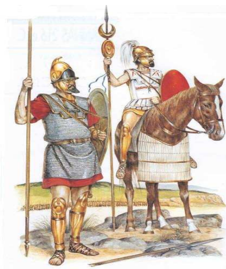
fig.3 Os romanos

2. Com a ocupação romana Olisipo desenvolveu-se na agricultura e no comércio sendo elevada a Município com o título Felicitas Júlia.